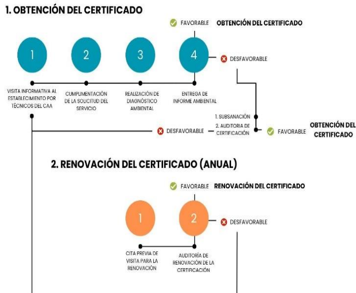
Figura 4. Procedimientos para la obtención del certificado de Calidad Ambiental.