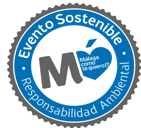
Figura 3. Sello de Evento Sostenible

En 2022, Málaga participó en 10 programas educativos , contando con 80.000 participantes anuales , y han sido desarrollados en 160 centros educativos .