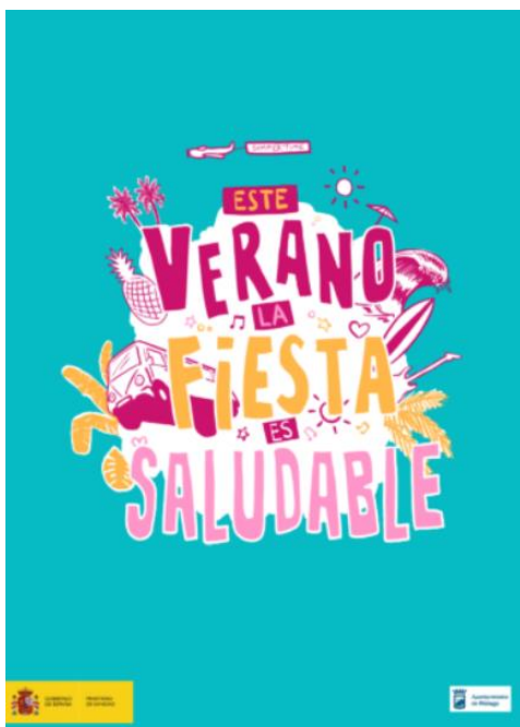
Figura 1: Campaña de sensibilización eventos estivales del COVID-19 y salud sexual (verano 2022)

Se contabilizan 272 farmacias en la ciudad en 2023.