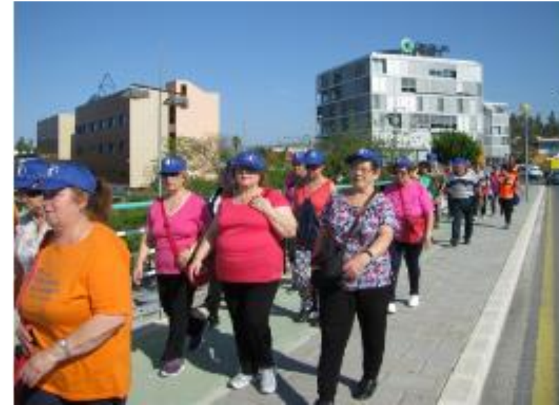
Figura 5: Paseos saludables